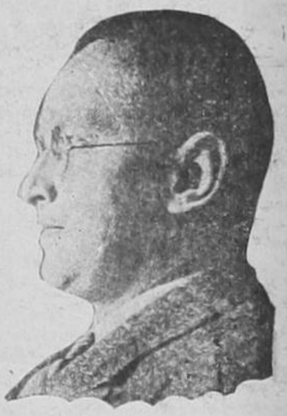
HENLEIN, a quien el gobierno checo ha hecho concesiones que favorecen las maniobras de Hitler

DERRIBADOS por las Fuerzas Leales 18 AVIONES FIAT y 1 TRIMOTOR