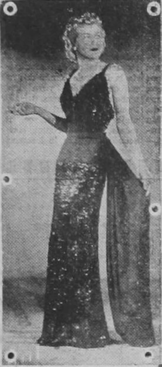
La moda en París. "Lumiére noire", vestido de noche en crepé de seda negro con paillettes negras. Creación Robert Piquet.