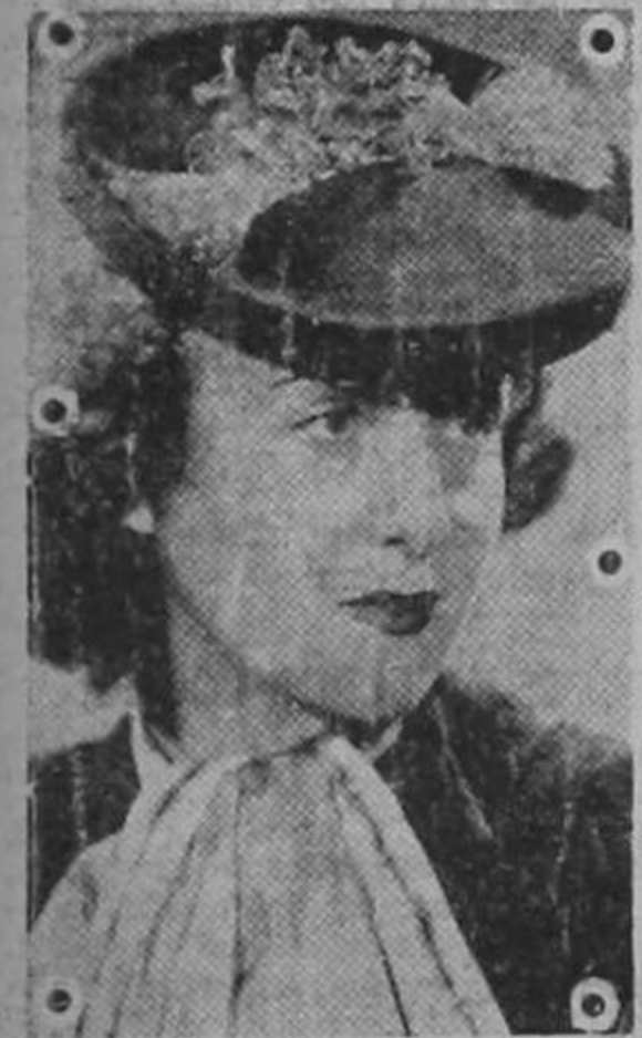
La moda en París. Toca en paja negra adornada con flores. Es una creación de la casa Louise Bourbon de París.