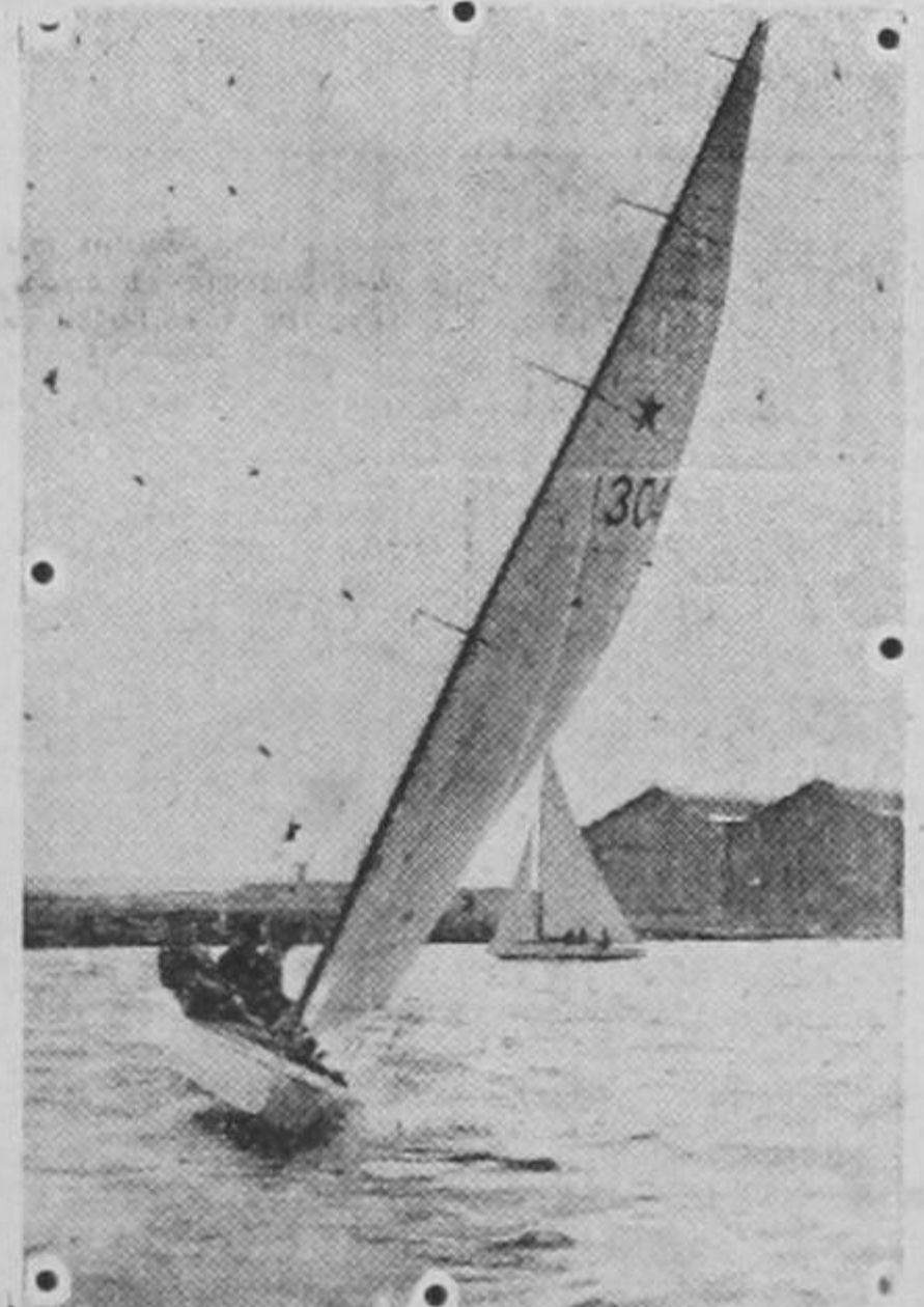
Actualmente se celebran en Francia las célebres regatas sobre el estanque de Meulan. El viraje de uno de los concurrentes.